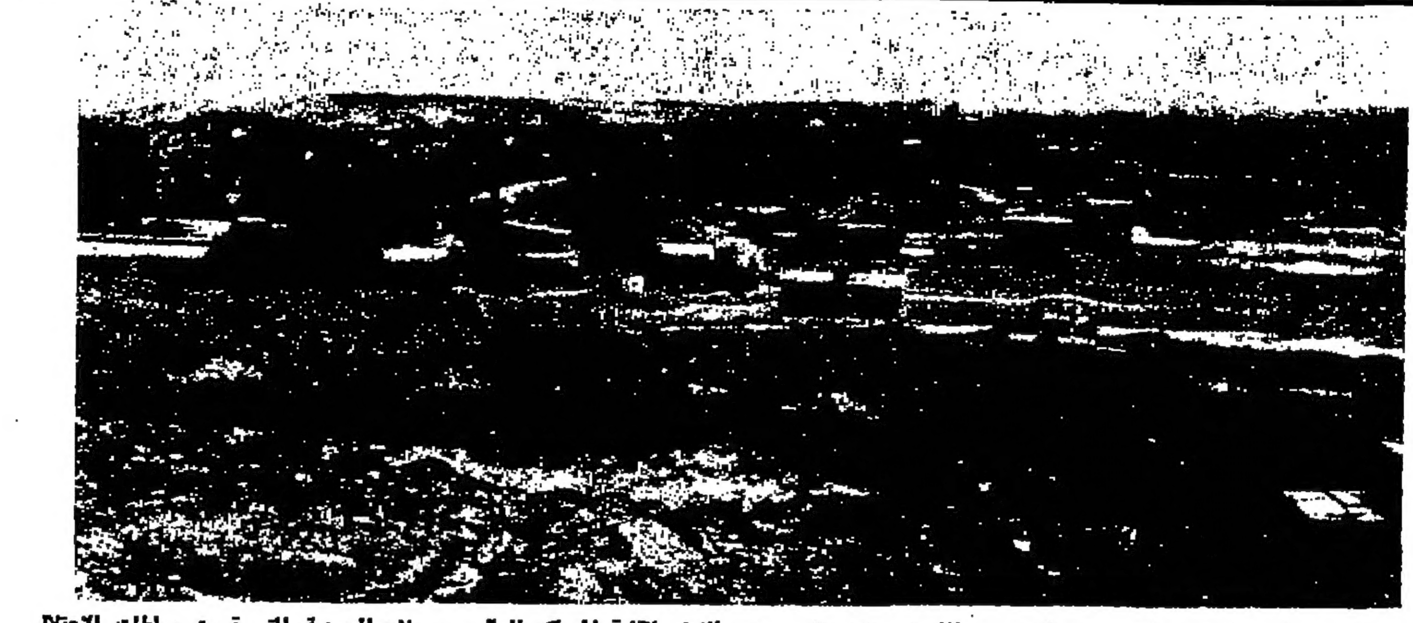
المخيمات الضخمة تزين السهل المشهور في الشيخ جراح بالقدس وتمهد الأرض لإقامة للمخيمات اليهودية التي قررت سلطات الاحتلال اسكتها في القدس

من يسقط الطائرة الـ ٣٠٠٠ ؟ هونغ كونغ - رويتر - يتسلسل الآن جنود متفجعة وطيارون فينماليون شماليون يمدون أنهم أسقطوا ٢٩٩٩ طائرة أميركية خلال أربع سنوات الرمز فيها ثلاثة آلاف. وذكرت وكالة أنباء فينلان المتكلمة أمس أن ٢٩٩٩ طائرة أسقطت منذ سنة ١٩٦٤ تسبب قاذفات قتال ضخمة من نوع ب ٥٢ وقاذفت قتال مختلفة من نوع ف ١١١ الجديدة ذي الأجنحة المتحركة. وأصدرت الوكالة لائحة بخمس المجرم الأميركي الذي ولد على أزيد مدى الحرب التي وصلت لزوجها في سنة ١٩٦٧ عندما أسقط أكثر من المس طائرة أميركية.